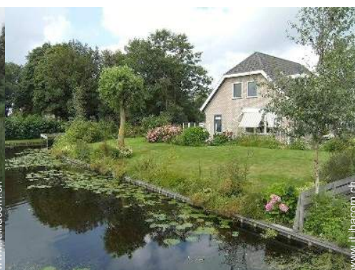
Apprezzamento di terreno