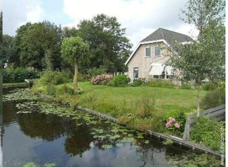
Apprezzamento di terreno