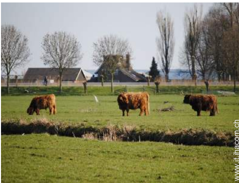
vista sul prato