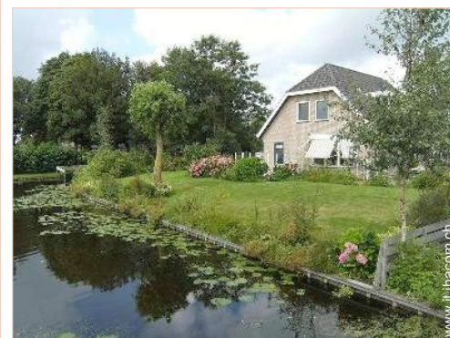
Appezzamento di terreno