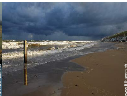
vista sul mare