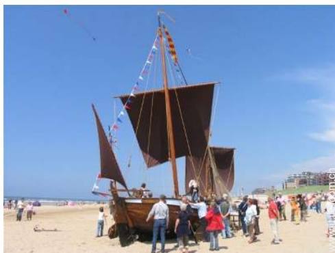
escursione in barca