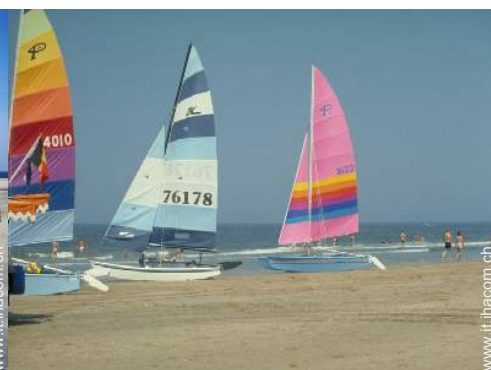
sport acquatici nelle vicinanze