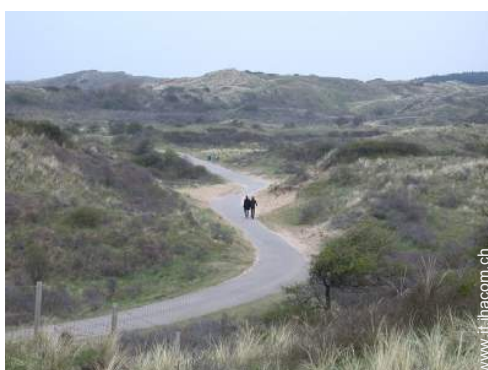
vista sulla campagna