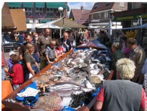
vista sul centro del paese