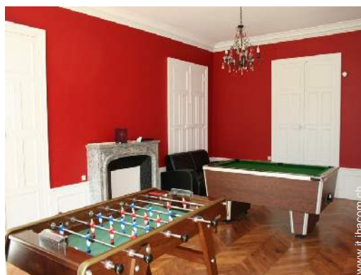
sala dei giochi