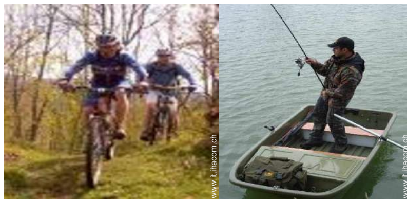
percorso per mountain bike