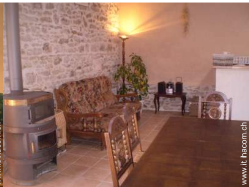
stufa a legna