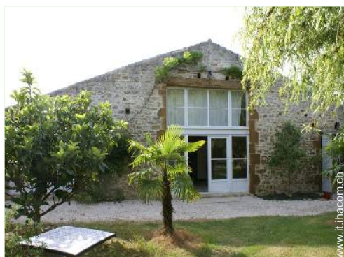
Antico Granaio di Charme