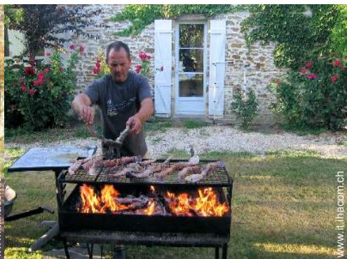
Il vostro ospite