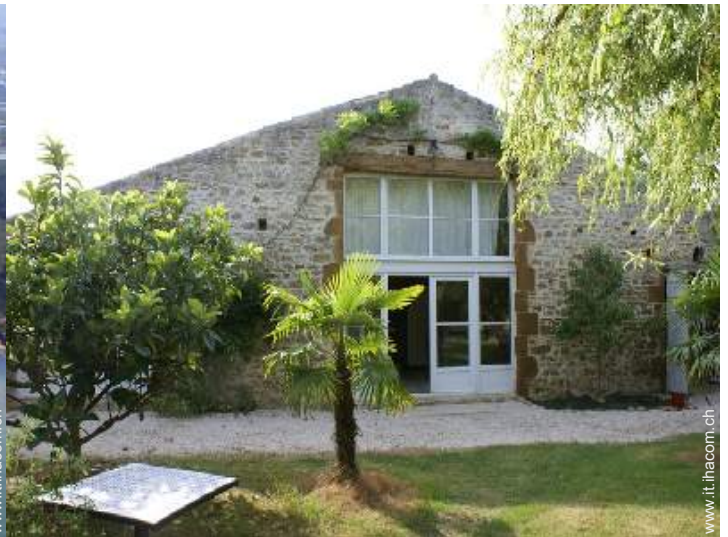
Antico Granaio di Charme