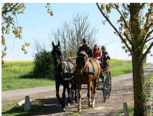
passaggiata in calesse