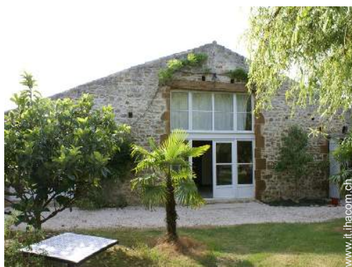
Antico Granaio di Charme