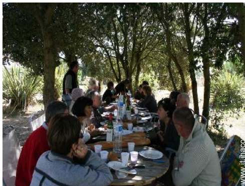
Installazione esterna a disposizione degli ospiti