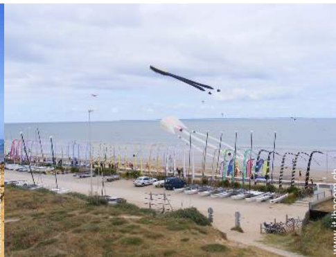
scuola di vela