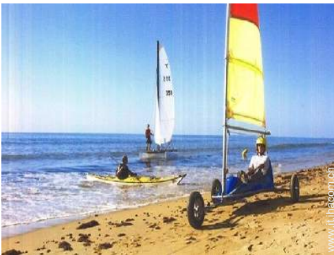
surf su sabbia