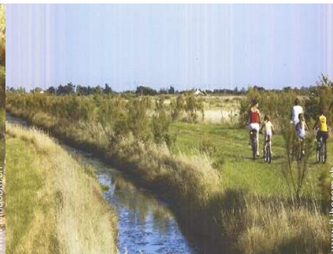
percorso per mountain bike