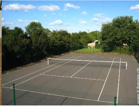
Tennis - superficie dura