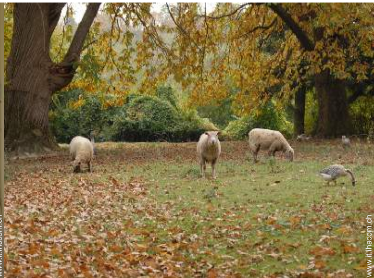
Gli animali domestici