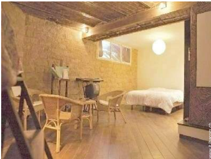
camera del proprietario