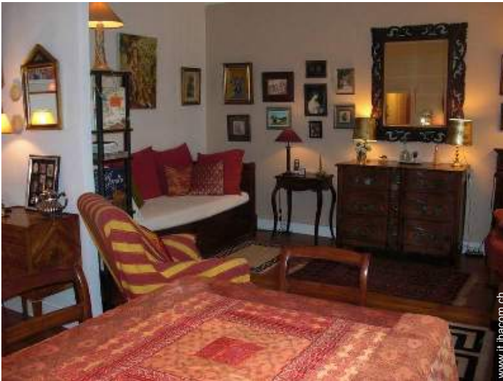
letto(i) a scomparsa 2 pers