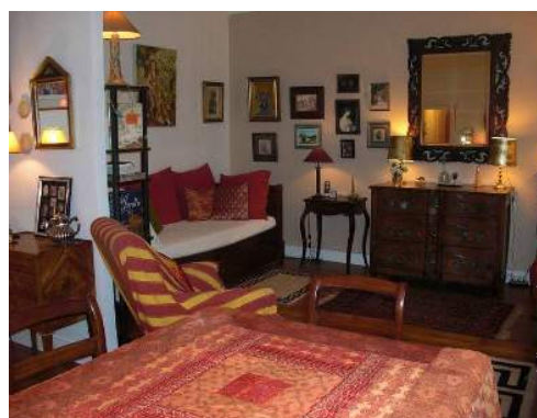
letto(i) a scomparsa 2 pers