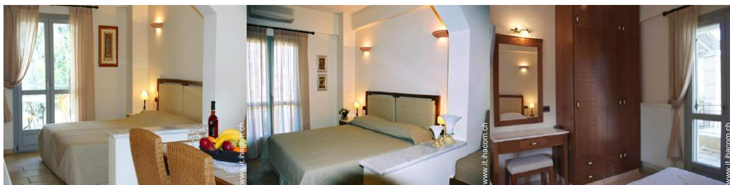
Maisonnette di Charme