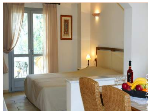
Maisonnette di Charme