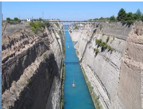
Attrazioni e relax