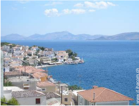
vista sul villaggio