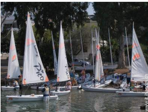
scuola di vela