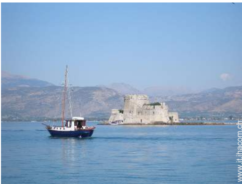
Attrazioni e relax