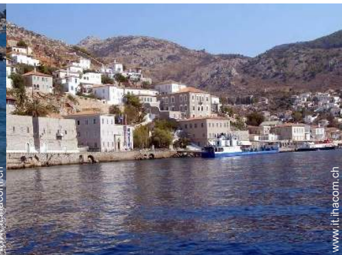
Attrazioni e relax