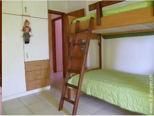
letti a castello