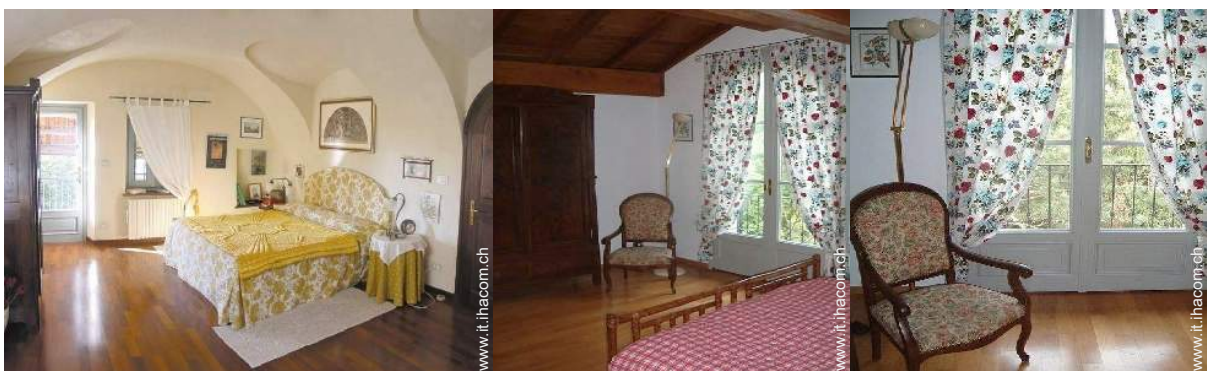
camera del proprietario