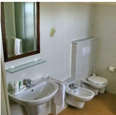
stanza di servizio