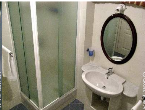
stanza di servizio