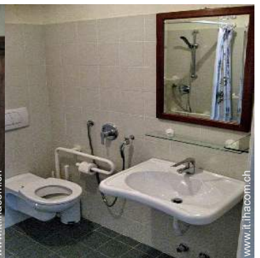
stanza di servizio