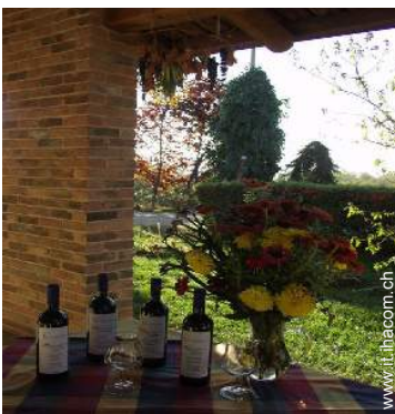
cantina e degustazione di vino