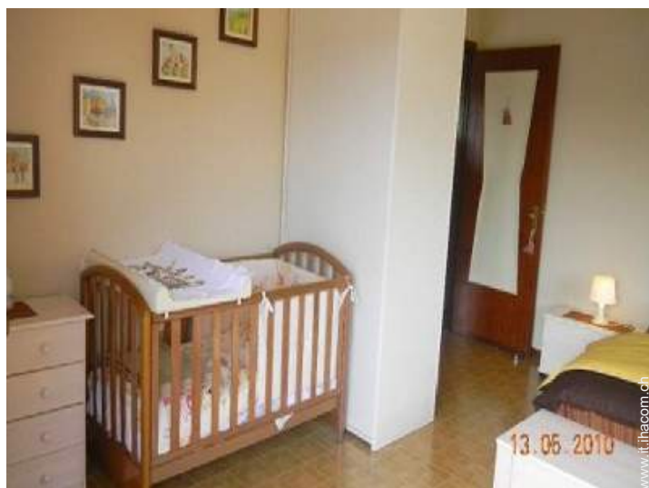
letto (i) bambino