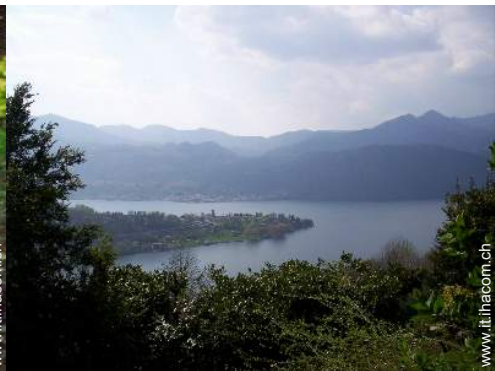
vista sul lago