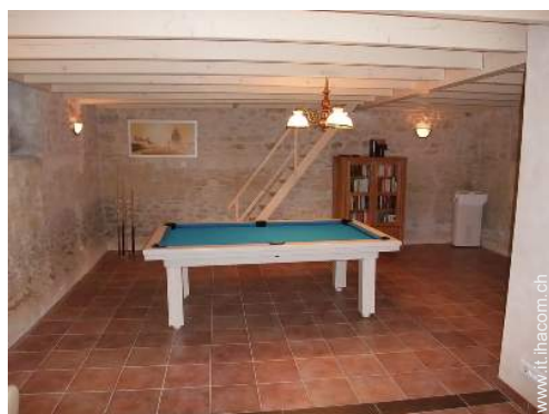
tavolo da biliardo