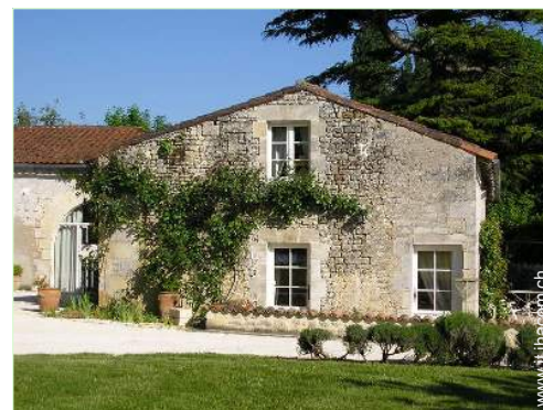
Casa di Charme