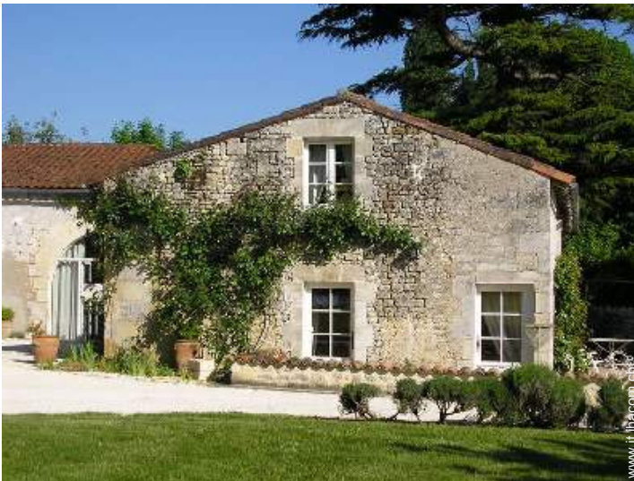
Casa di Charme