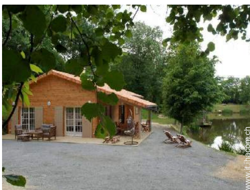
Casa in Legno di Charme