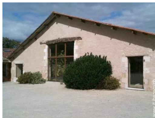
Casa Tipica di Charme