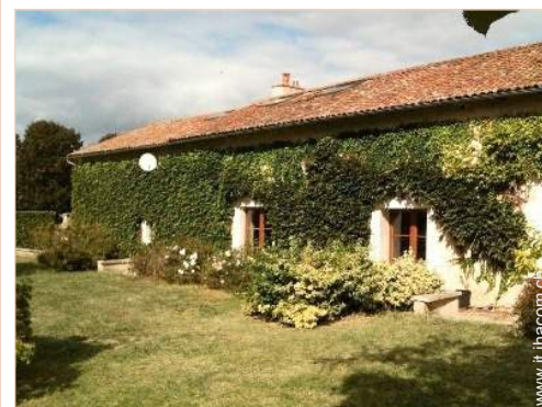
Casa Tipica di Charme