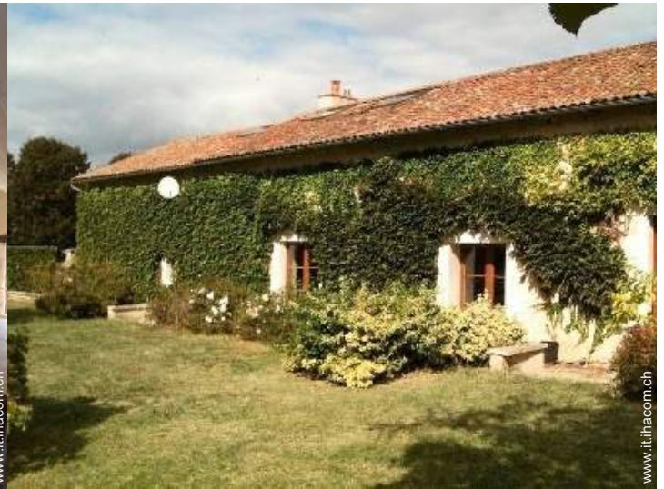
Casa Tipica di Charme