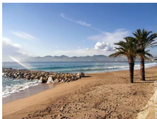
sport estivi nelle vicinanze