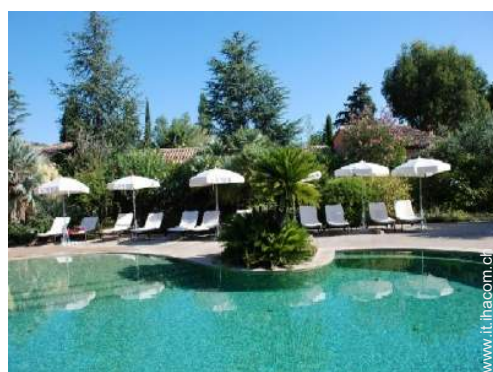
Piscina a sfioro