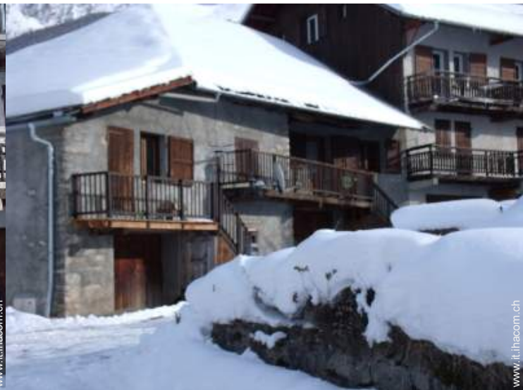
Casa di Villaggio