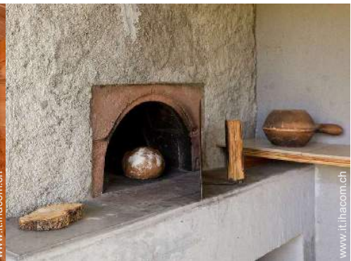
forno per pizze