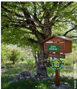
Chalet di Montagna di Charme