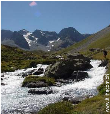
rapide sui fiumi