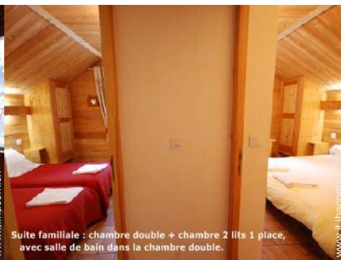
Suite familiale : chambre double + chambre 2 lits 1 place, avec salle de bain dans la chambre double.