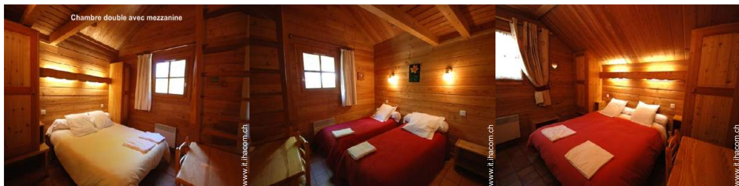
Chambre double avec mezzanine