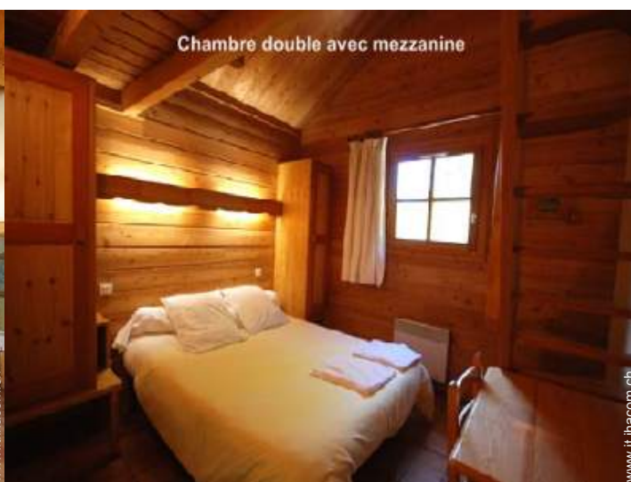
Chambre double avec mezzanine