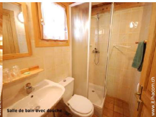
Salle de bain avec douche