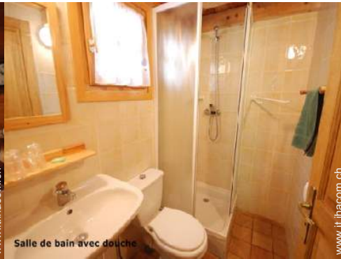
Salle de bain avec douche