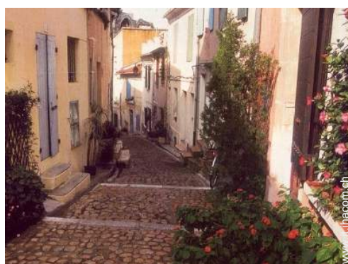
Casa di Città