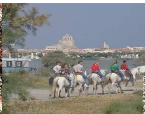
sport estivi nelle vicinanze