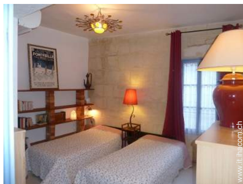
letti gemelli singoli