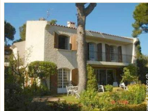
Casa Provenzale di Lusso