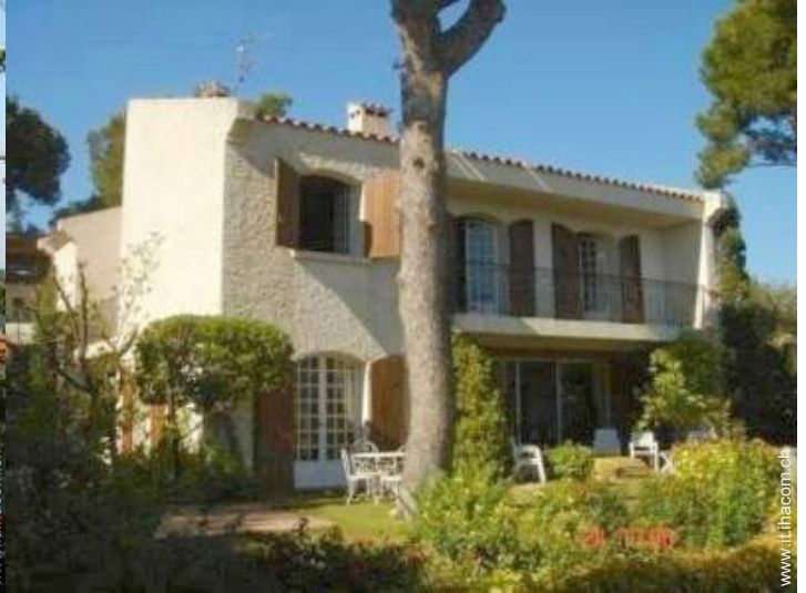
Casa Provenzale di Lusso