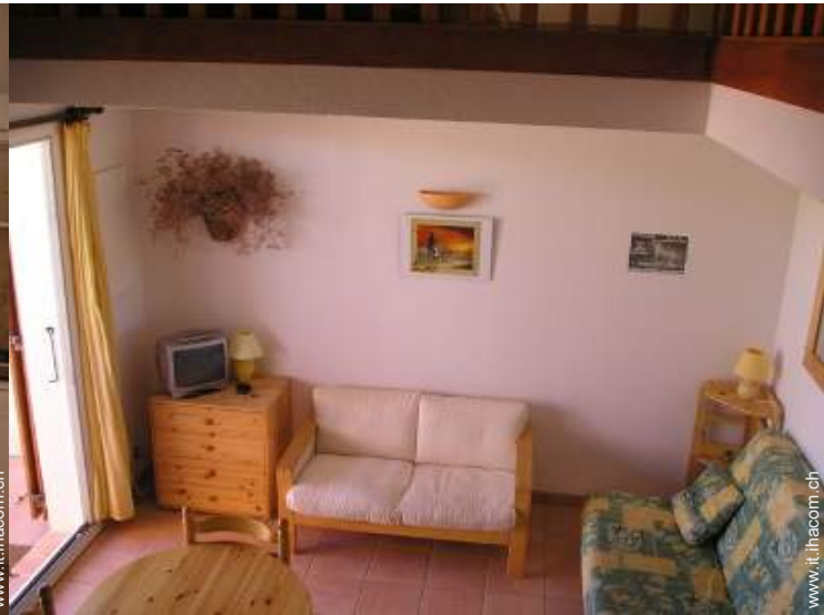
vista dal mezzanino