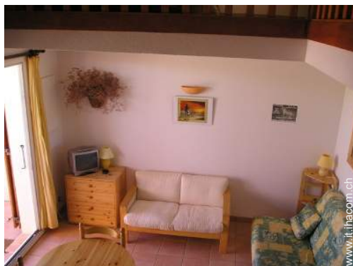
vista dal mezzanino