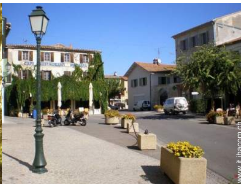
vista sul centro del paese