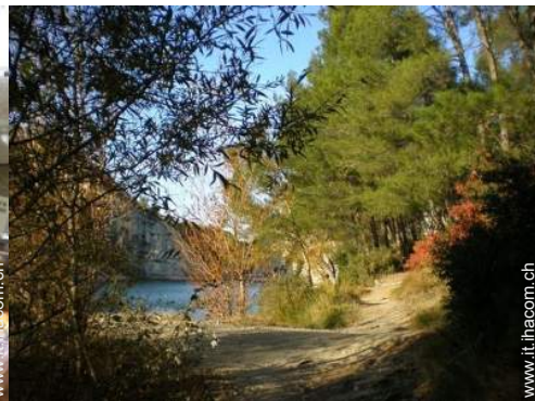
attrezzature ricreative nelle vicinanze