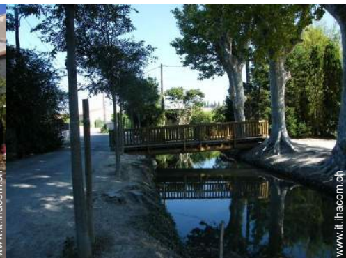
vista sul villaggio