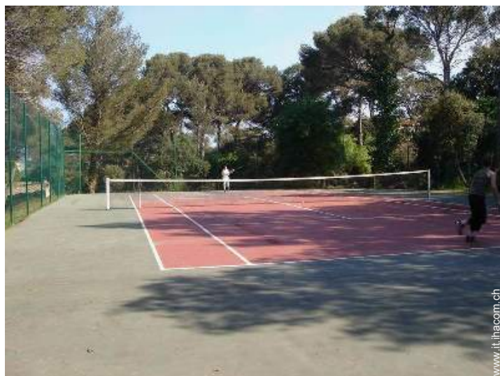
campo da tennis in comune