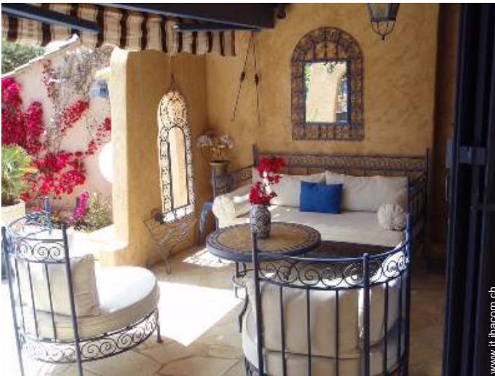
Casa di Charme