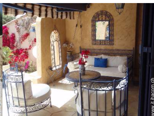
Casa di Charme