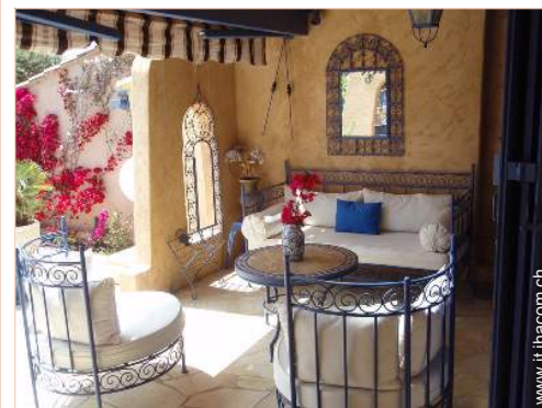
Casa di Charme