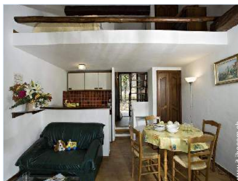
Disposizione interna e confort