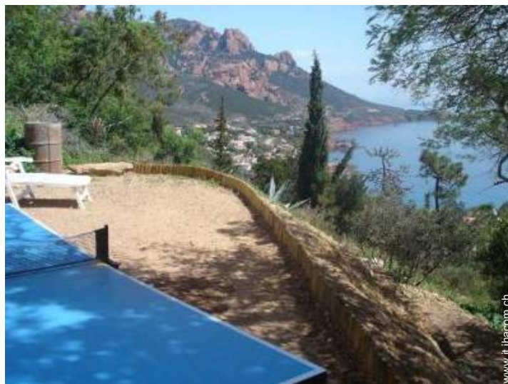
tavolo da ping-pong