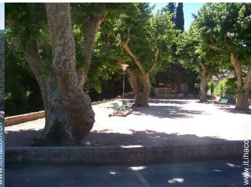
campo di bocce