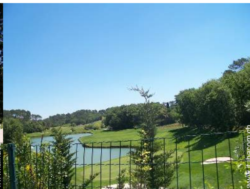
percorso di golf 18 buche