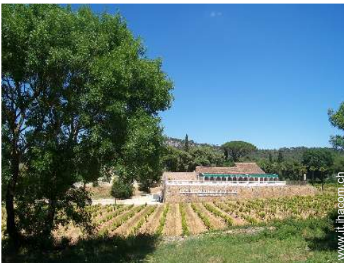
cantina e degustazione di vino