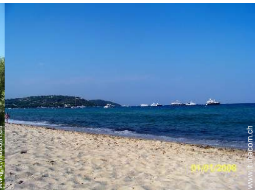
sport acquatici nelle vicinanze