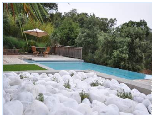
Piscina a sfioro