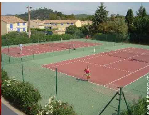
campo da tennis in comune