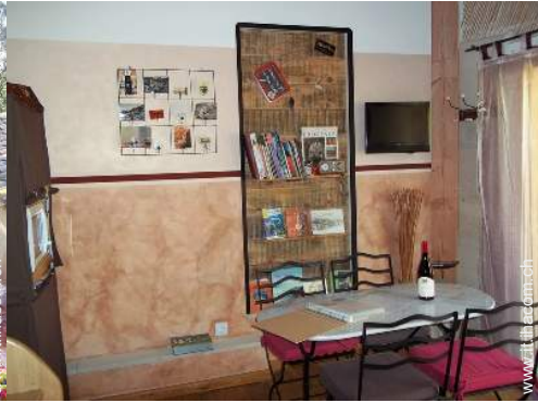
Comfort interno a disposizione degli ospiti