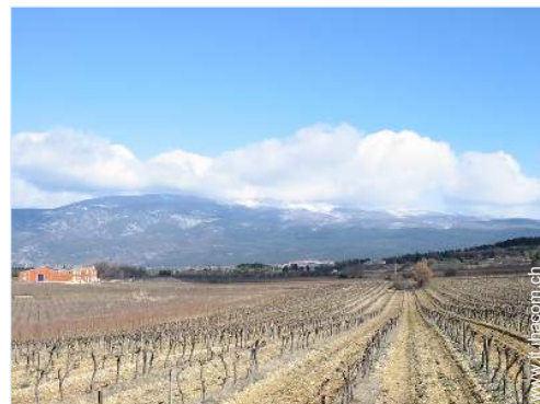
vista sui vigneti

Tavolo da giardino, sedia(e) da giardino, ombrellone, sedia sdraio, doccia esterna