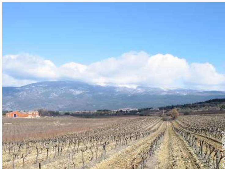
vista sui vigneti