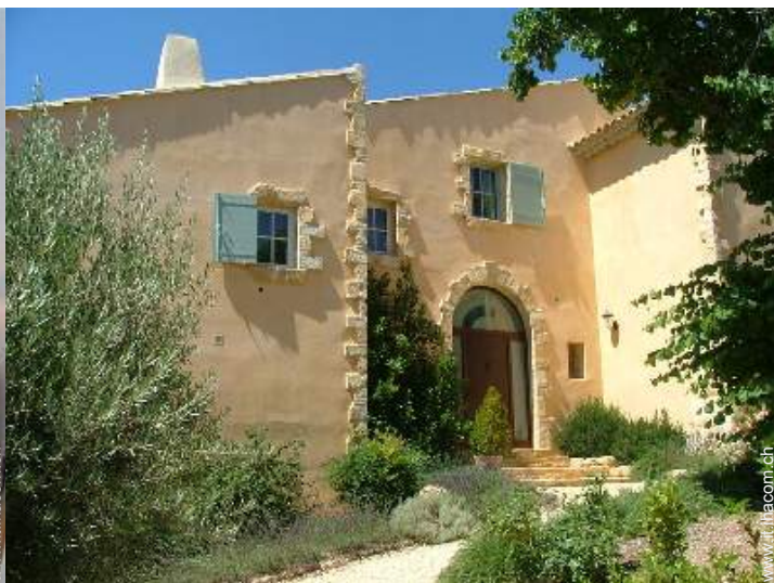
Casa Provenzale di Lusso