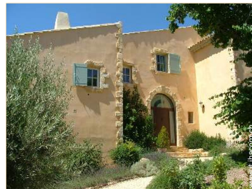
Casa Provenzale di Lusso