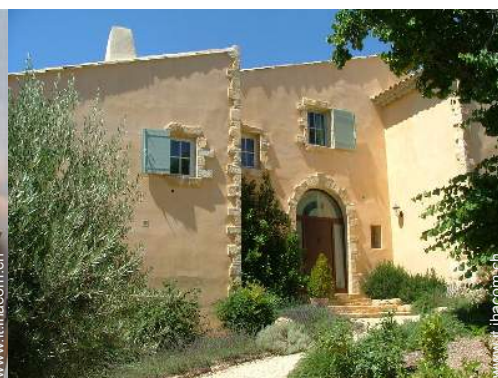
Casa Provenzale di Lusso