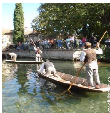
Attrazioni e relax