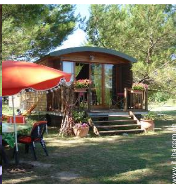
Roulotte di Charme