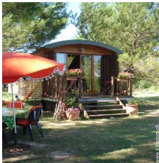
Roulotte di Charme