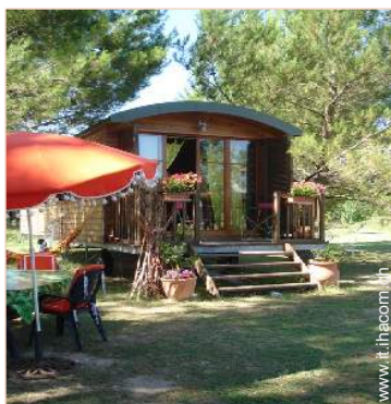
Roulotte di Charme