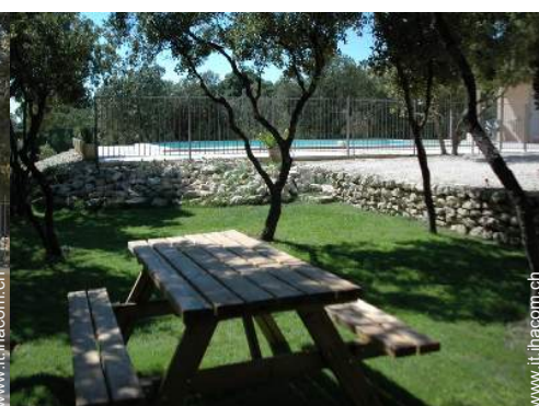
salotto da giardino