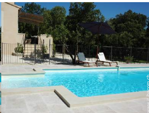
piscina per bambini