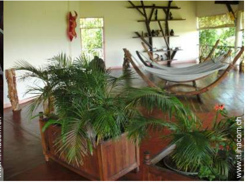
Attrezture a disposizione