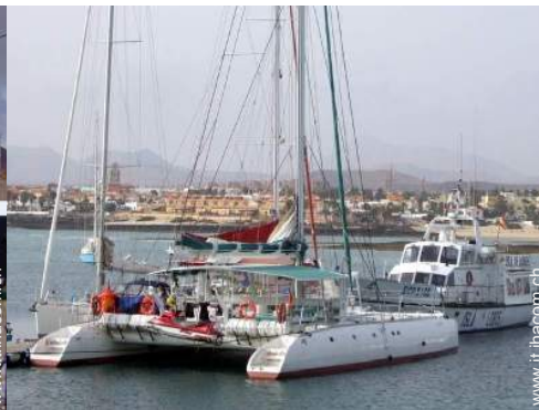
escursione in barca