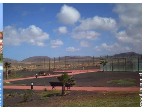
Tennis - superficie sintetica