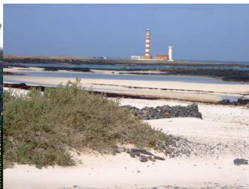
luogo per bagnarsi