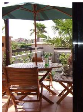
salotto da giardino