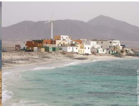
spiaggia dei nudisti