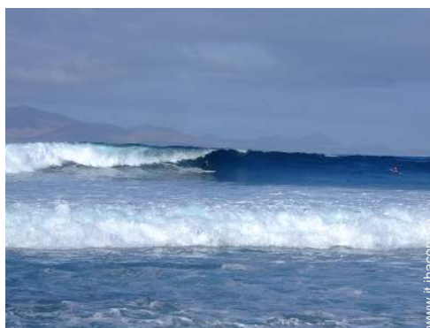
punto di surf