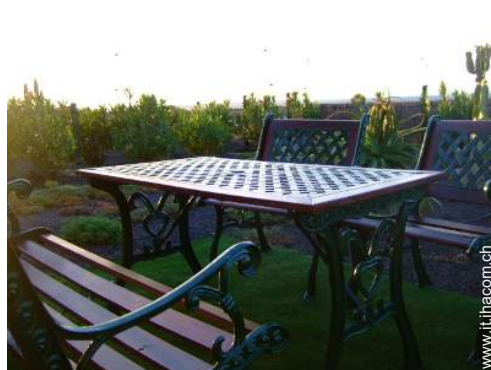
salotto da giardino