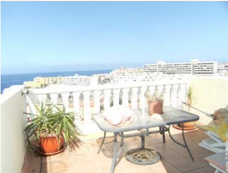
terrazzo sul tetto