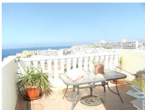
terrazzo sul tetto