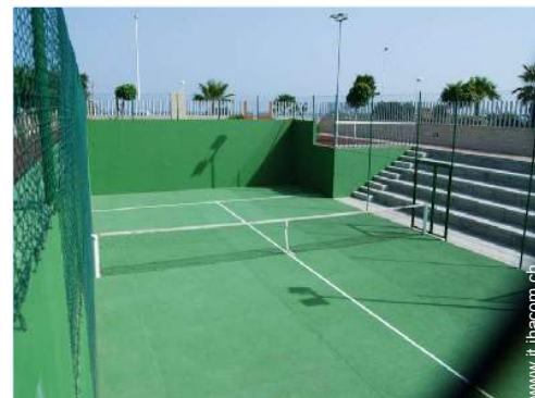
Tennis - superficie dura

Tavolo da giardino, 4 sedia(e) da giardino, 4 amaca(che), vasca per la sabbia, doccia esterna