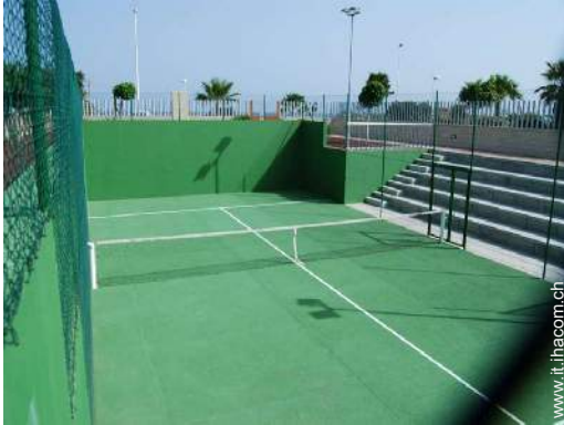
Tennis - superficie dura