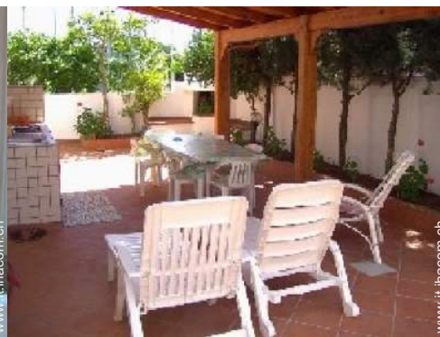
tettoia di giardino