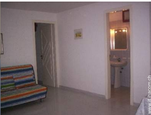
divano(i) letto 1 pers