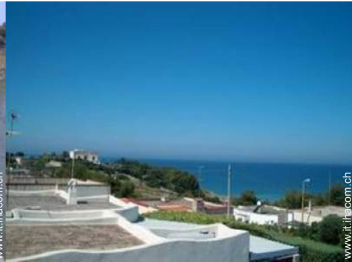
vista dalla terrazza sul tetto