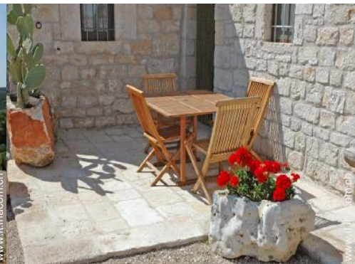
sedia(e) da giardino