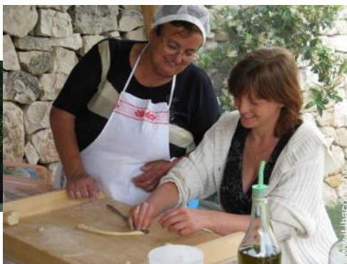
preparazione pasti tipici