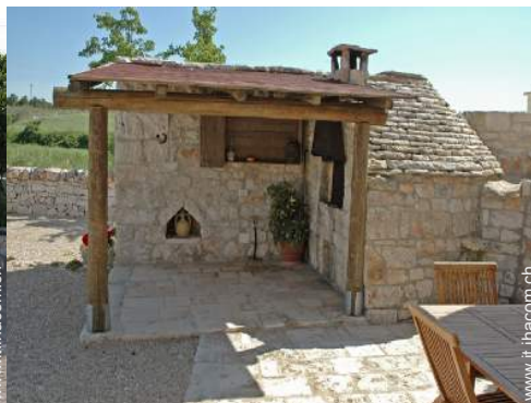
forno per pizze