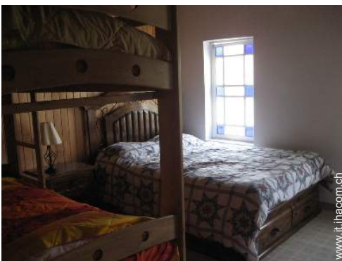
Bungalow di Prestigio