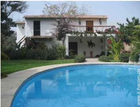
Bungalow di Prestigio