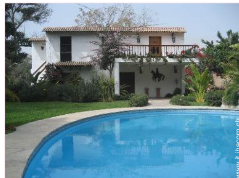
Bungalow di Prestigio

Camino, TV, stoviglie/posate, videoregistratore, lettore DVD, collezione di film, telefono, computer, cavo/satellite, accesso internet, accesso internet banda larga, asciugacapelli, macchina del ghiaccio, zanzariera per finestre, ventilatore, ventilatore a pale da soffitto, stufa a legna