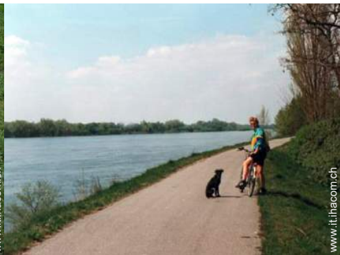
sport estivi nelle vicinanze