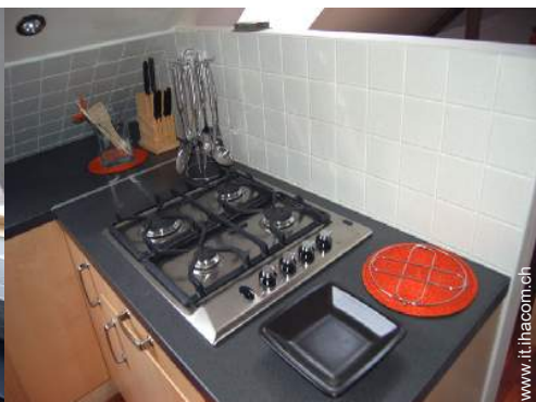
cucina a gas