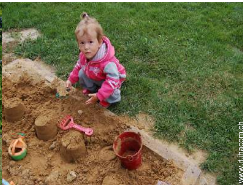
vasca per la sabbia