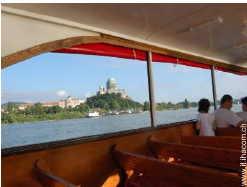
escursione in barca