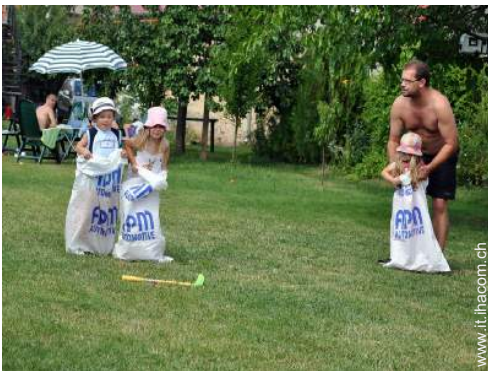
vista sul prato