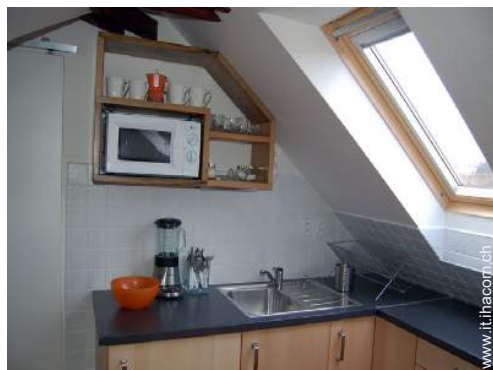
utensili e batteria da cucina